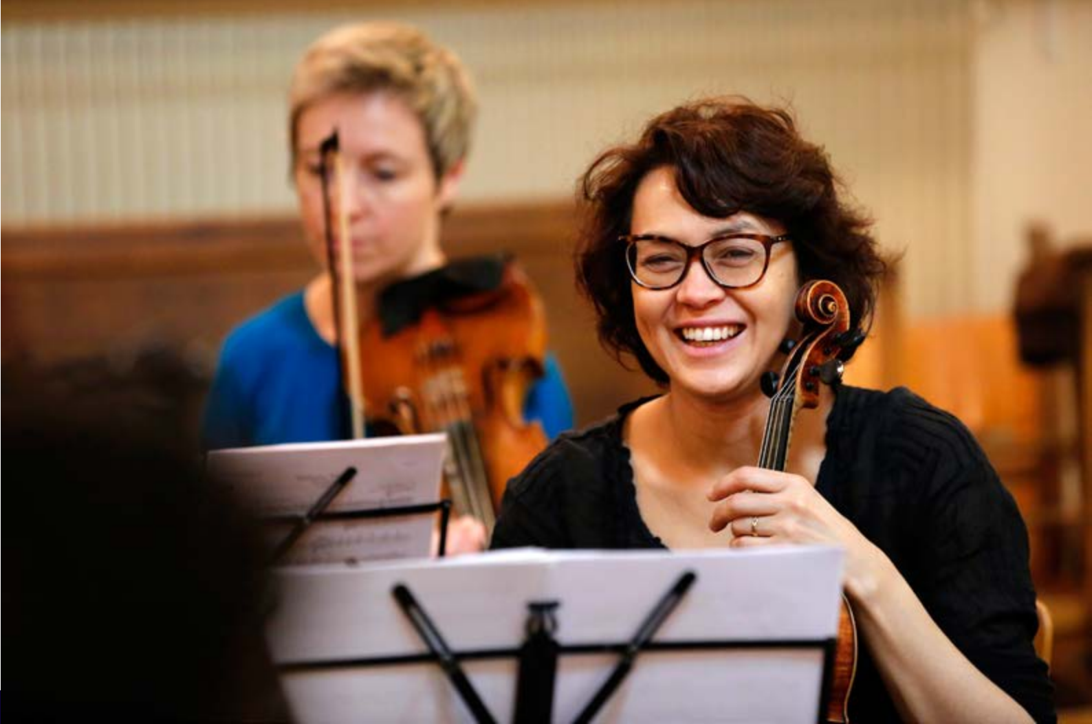
Graphisme Motifcreation

Pulcinella est soutenu par la Région Île-de-France, la Drac Île-de-France, l'Adami, la Spedidam, ainsi que le Bureau Export et l'Institut Français pour ses tournées internationales.